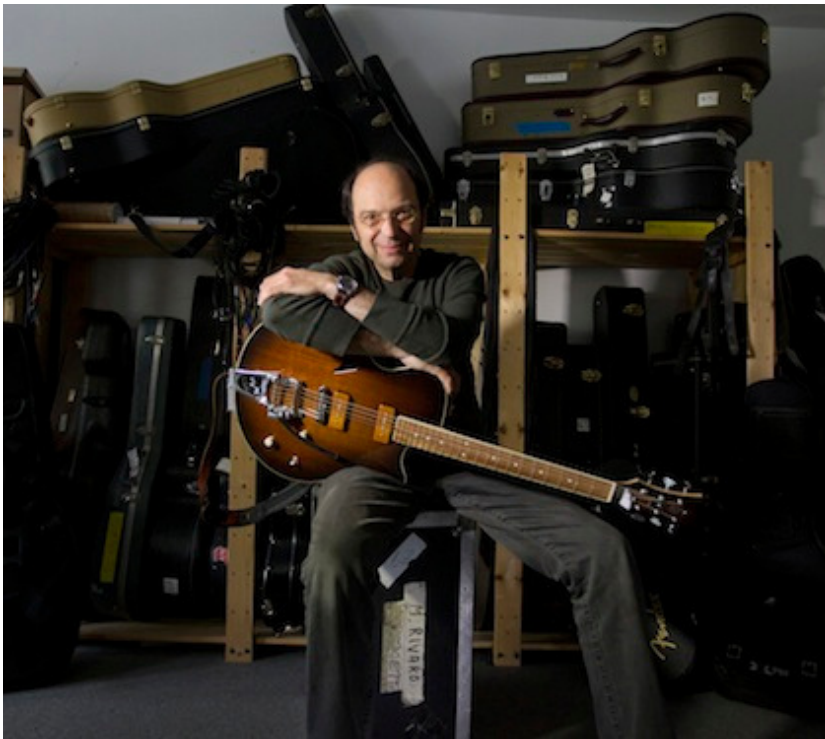
Ivanoh Demers, La Presse